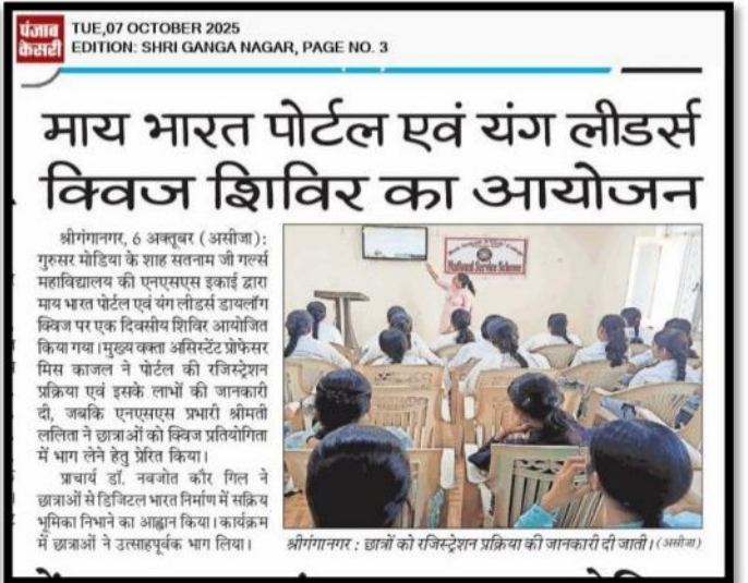
श्रीगंगानगर : छात्राओं को रजिस्ट्रेशन प्रक्रिया की जानकारी दी जाती। (असिस्टेंट)