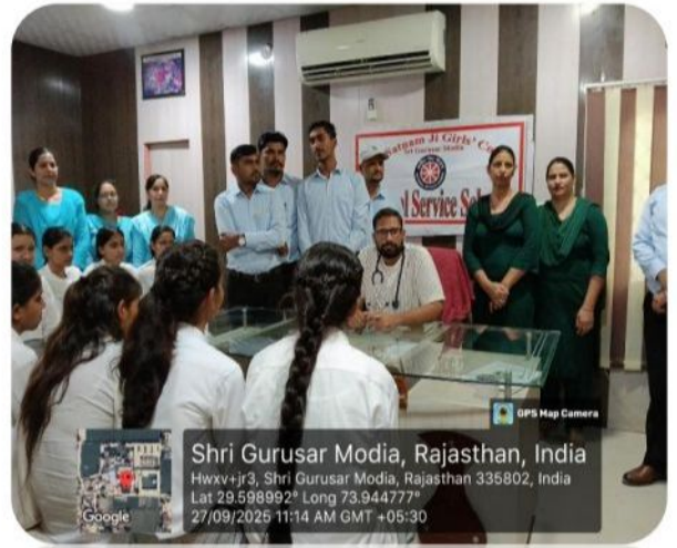
Shri Gurusar Modia, Rajasthan, India Hwxv+jr3, Shri Gurusar Modia, Rajasthan 335802, India Lat 29.598992° Long 73.944777° 27/09/2025 11:14 AM GMT +05:30