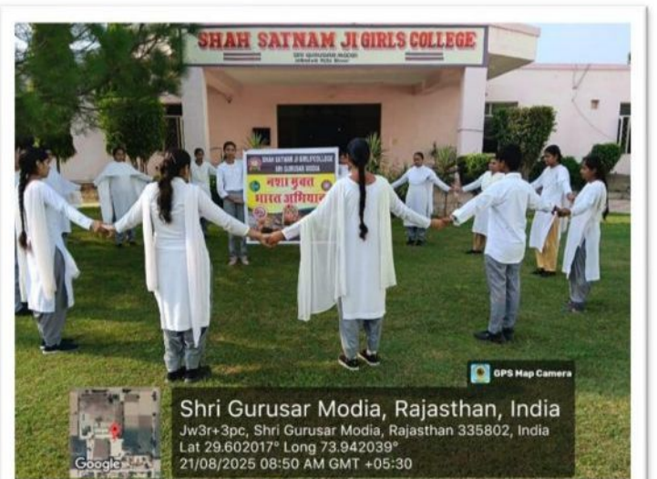
Shri Gurusar Modia, Rajasthan, India Jw3r+3pc, Shri Gurusar Modia, Rajasthan 335802, India Lat 29.602017° Long 73.942039° 21/08/2025 08:50 AM GMT +05:30