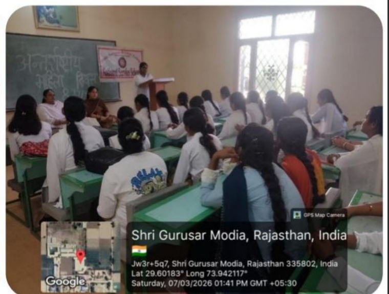
Shri Gurusar Modia, Rajasthan, India

Jw3r+5q7, Shri Gurusar Modia, Rajasthan 335802, India Lat 29.60183° Long 73.942117° Saturday, 07/03/2026 01:37 PM GMT +05:30