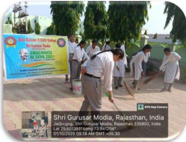
Shri Gurusar Modia, Rajasthan, India Jw2r+gcg, Shri Gurusar Modia, Rajasthan 335802, India Lat 29.601351° Long 73.941204° 01/10/2025 09:18 AM GMT +05:30

इस अवसर पर छात्राओं ने स्वच्छता एवं अहिंसा की शपथ ली तथा गांधी जी के आदर्शों को अपने जीवन में अपनाने का संकल्प किया। कार्यक्रम का समापन राष्ट्रगान के साथ किया गया।