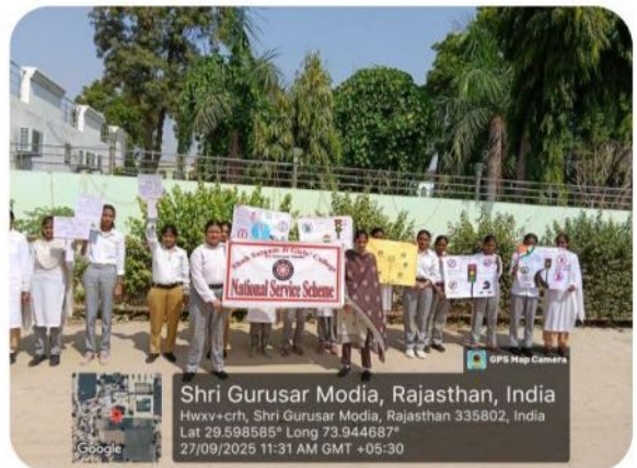
Shri Gurusar Modia, Rajasthan, India Hwxv+crh, Shri Gurusar Modia, Rajasthan 335802, India Lat 29.598585° Long 73.944687° 27/09/2025 11:31 AM GMT +05:30