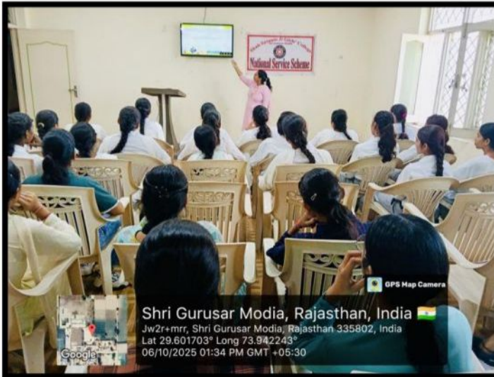
Shri Gurusar Modia, Rajasthan, India Jw2f+mrr, Shri Gurusar Modia, Rajasthan 335802, India Lat 29.601703° Long 73.942243° 06/10/2025 01:34 PM GMT +05:30