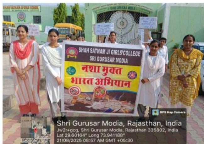
Shri Gurusar Modia, Rajasthan, India Jw2r+gcg, Shri Gurusar Modia, Rajasthan 335802, India Lat 29.60164° Long 73.941188° 21/08/2025 08:57 AM GMT +05:30