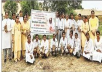
पौधारोपण किया जाता।

कार्यक्रम के तहत 40 पौधे लगाए गए, जिसमें कॉलेज की 22 छात्राओं एवं 17 स्टाफ सदस्यों ने बड़-बड़कर