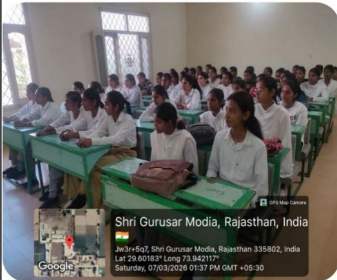
Shri Gurusar Modia, Rajasthan, India

Jw3r+5q7, Shri Gurusar Modia, Rajasthan 335802, India Lat 29.60183° Long 73.942117° Saturday, 07/03/2026 01:37 PM GMT +05:30