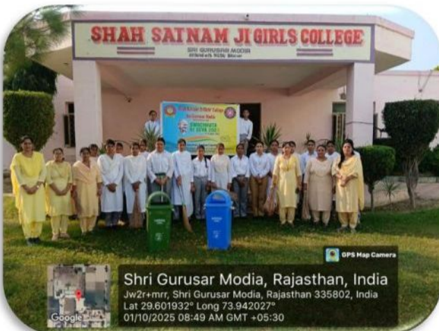
Shri Gurusar Modia, Rajasthan, India Jw2r+mrr, Shri Gurusar Modia, Rajasthan 335802, India Lat 29.601932° Long 73.942027° 01/10/2025 08:49 AM GMT +05:30