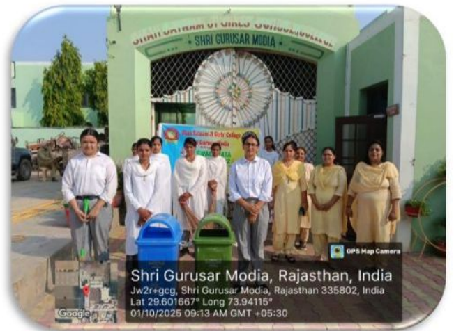
Shri Gurusar Modia, Rajasthan, India Jw2r+gcg, Shri Gurusar Modia, Rajasthan 335802, India Lat 29.601667° Long 73.94115° 01/10/2025 09:13 AM GMT +05:30