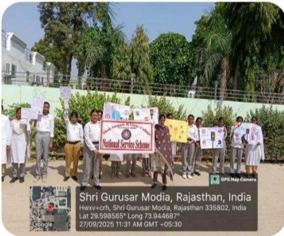
Shri Gurusar Modia, Rajasthan, India Hwxv+crh, Shri Gurusar Modia, Rajasthan 335802, India Lat 29.598585° Long 73.944687° 27/09/2025 11:31 AM GMT +05:30

इसी दिन छात्राओं द्वारा सड़क सुरक्षा के प्रति जागरूकता फैलाने हेतु रैली का भी आयोजन किया गया, जिसके माध्यम से समाज को जागरूक करने का संदेश दिया गया।